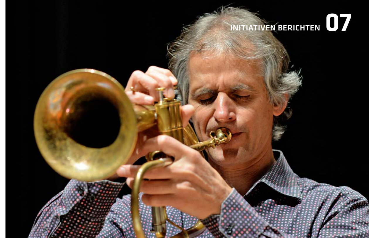
Komponist und Trompeter Markus Stockhausen