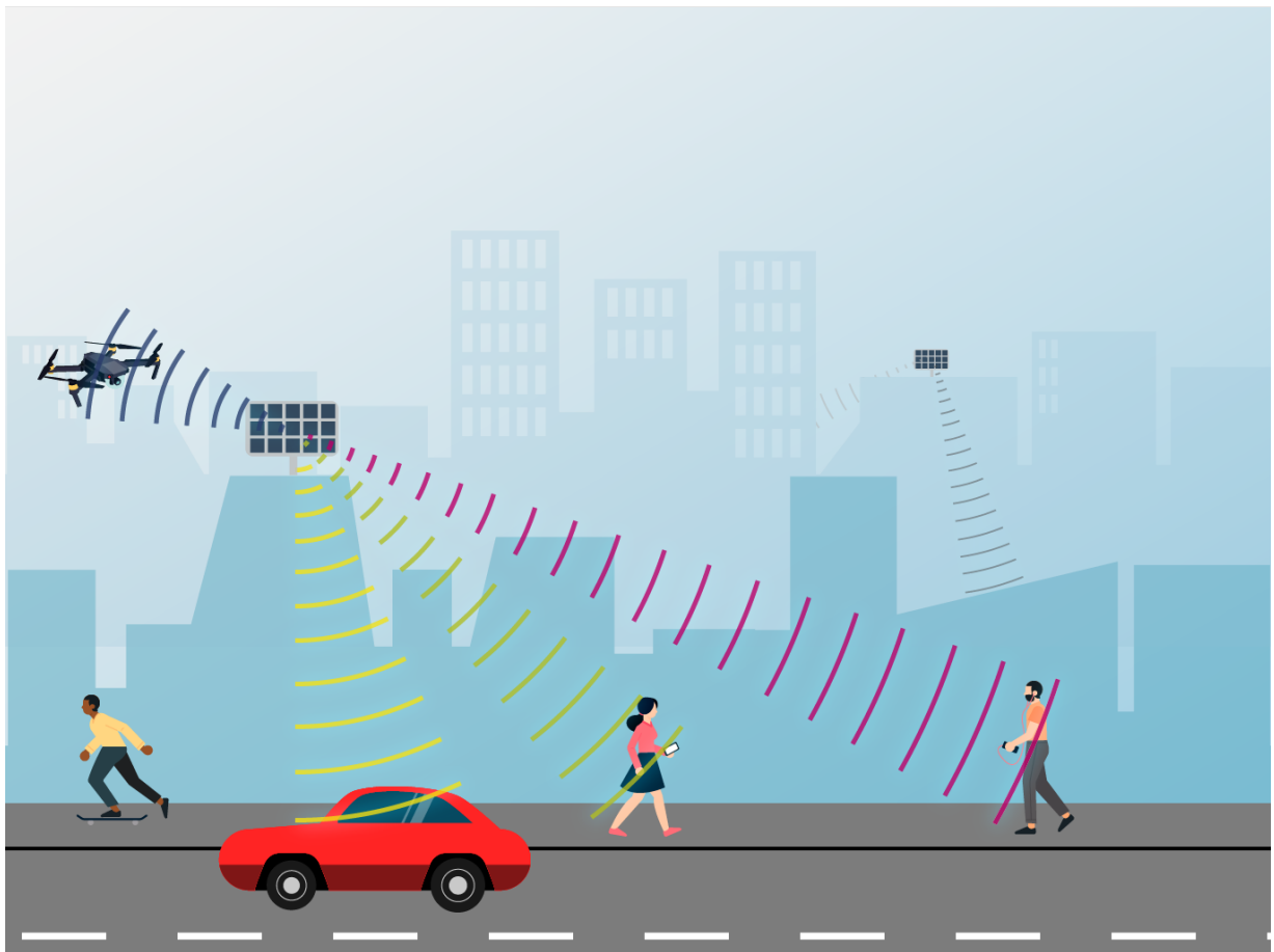
Abbildung 2: Adaptive Antennen senden Daten spezifisch in Richtung Endgerät

Die adaptiven Antennen bestehen aus einer Anordnung von einzeln ansteuerbaren Transmitterelementen. Werden nun mehrere Transmitterelemente in einer Gruppe zusammengefasst, können sie ihre Daten gezielt in eine Richtung senden. So können mehrere Gruppen von Transmitterelementen ihre Daten gleichzeitig in unterschiedliche Richtungen aussenden. Dabei teilen sie sich die für eine Antenne maximal verfügbare Sendeleistung, wodurch die Sendeleistung in jede gleichzeitig gezielte Richtung geringer wird.