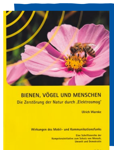
Bereits 2007 in der „Bienenbroschüre“ beschrieb Dr. Warnke die Rolle von Oxidativem Zellstress

Die Folge des vollzogenen TH1-TH2-Switches ist, dass Bakterien und Viren nicht mehr ausreichend bekämpft werden. Hält der Zustand länger an, dann wird der Organismus latent anfälliger für opportunistische Infektionen und chronische Krankheiten. Es kommt zur subklinischen Chronifizierung von Infektionen mit wechselnder Schwere der Symptome. Das chronische Ermüdungssyndrom (CFS) sowie das sogenannte Burn-out-Syndrom können sich nun etablieren. Außerdem ist nach der Umschaltung auf die Antikörper-Verteidigung der Autoimmunität (Angriff auf die eigenen