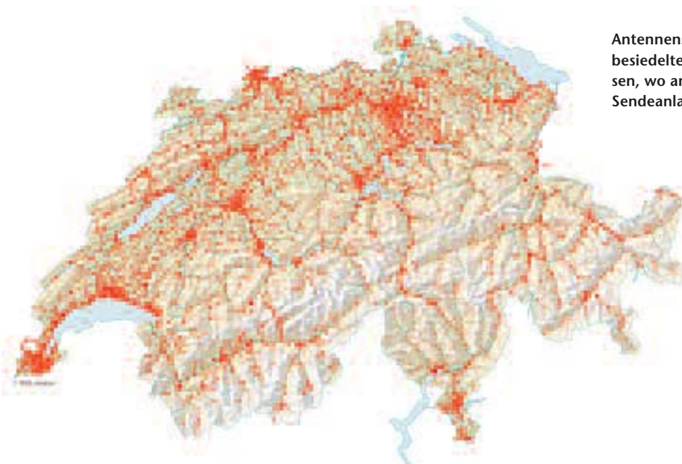
Antennenstandorte für den Mobilfunk: In den dicht besiedelten Zentren und entlang den Hauptverkehrsachsen, wo am meisten telefoniert wird, ist auch das Netz der Sendeanlagen sehr dicht. Stand: 15. Februar 2006.